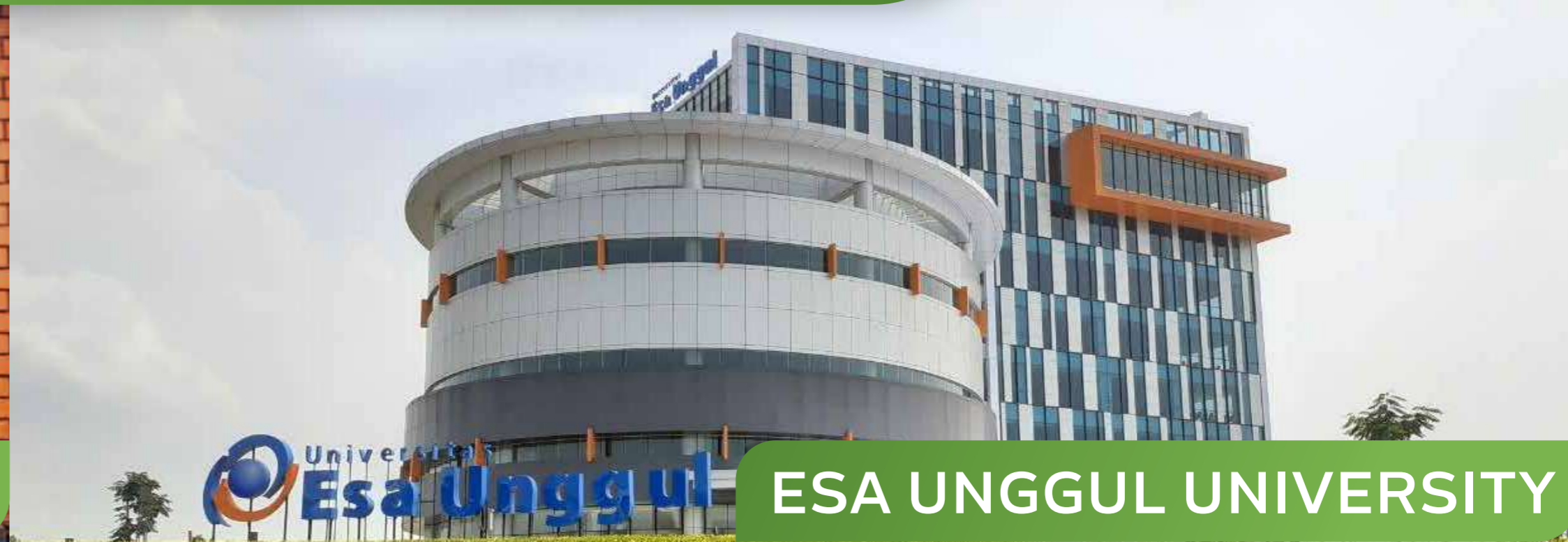
ESA UNGGUL UNIVERSITY