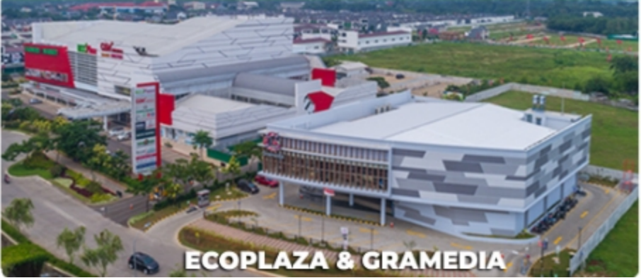
ECOPLAZA & GRAMEDIA