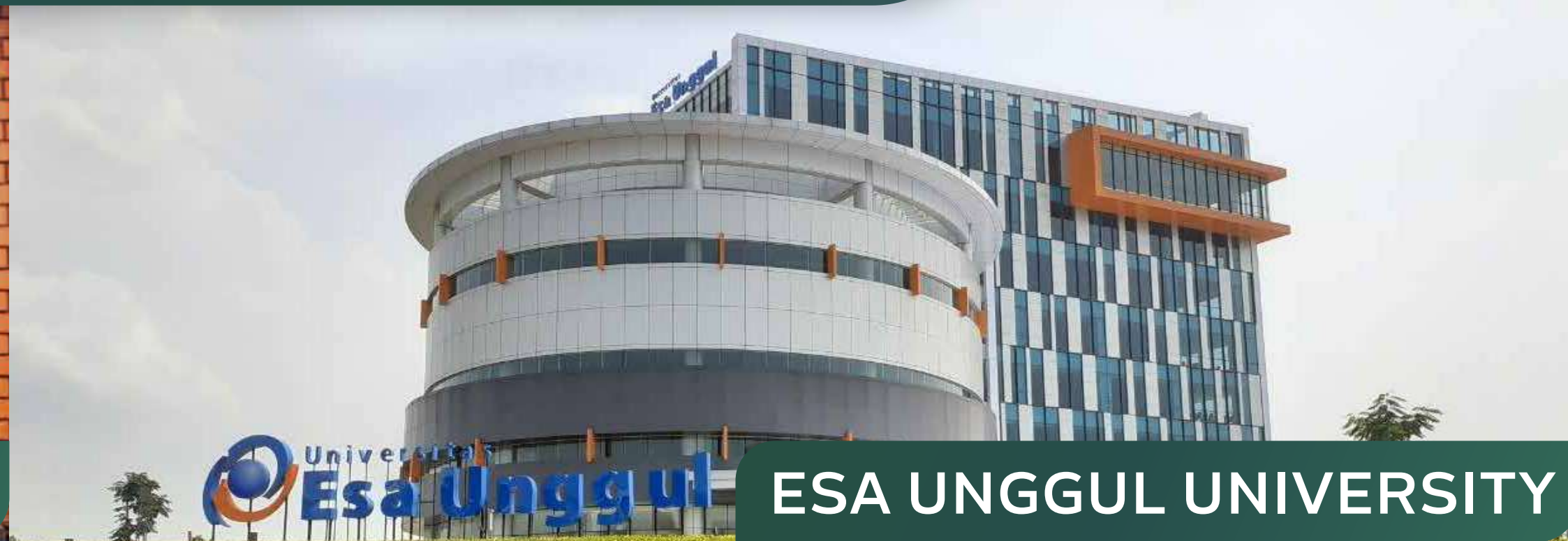
ESA UNGGUL UNIVERSITY