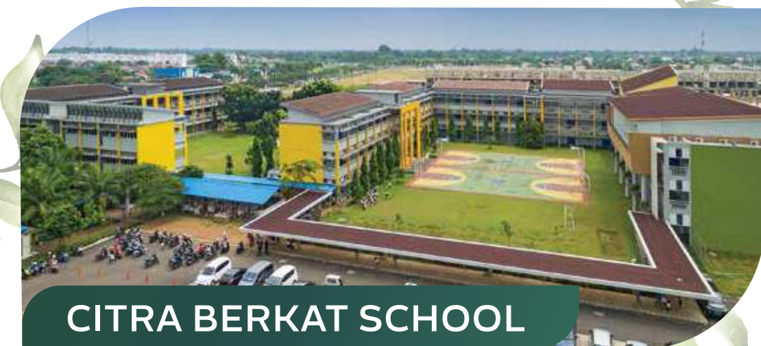
CITRA BERKAT SCHOOL