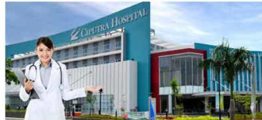
Ciputra Hospital rumah sakit umum swasta pertama dari Grup Ciputra dengan konsep modern, bersih dan hijau ini hadir untuk kebutuhan kesehatan Anda.