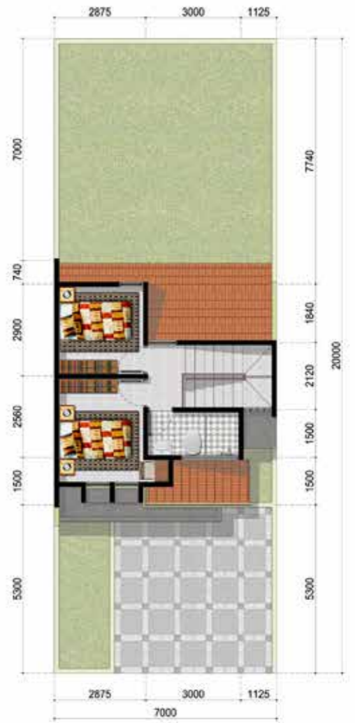
denah LANTAI 2