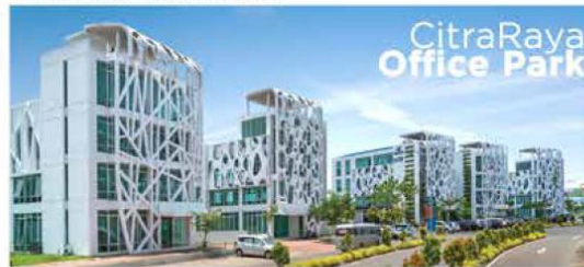
CitraRaya Office Park kawasan bisnis terbaru dan terlengkap untuk memenuhi kebutuhan ruang usaha yang terintegrasi dan letak yang sangat strategis.