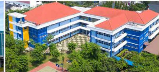
Fasilitas pendidikan yang beragam mulai dari Sekolah Citra Berkas, Yayasan Islamic Village, Yayasan Tarakanita, Universitas Esa Unggul dan beberapa sekolah lainnya.