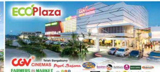
Mal dan Shopping Center untuk memenuhi kebutuhan sehari-hari dan mendukung gaya hidup penghuni. Lokasi strategis dengan ruang terbuka yang luas.