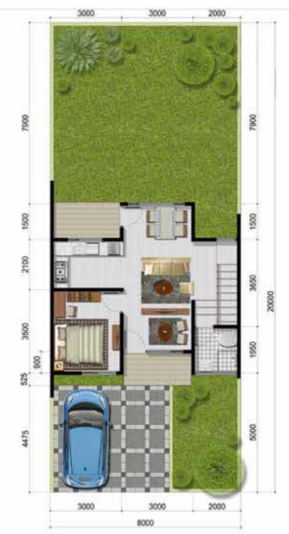
denah LANTAI 1