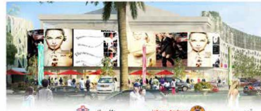
Tealah Bergabung Commercial Center Grand Arcade merupakan tempat belanja, berbisnis dan kuliner yang berlokasi di Ecopolis.