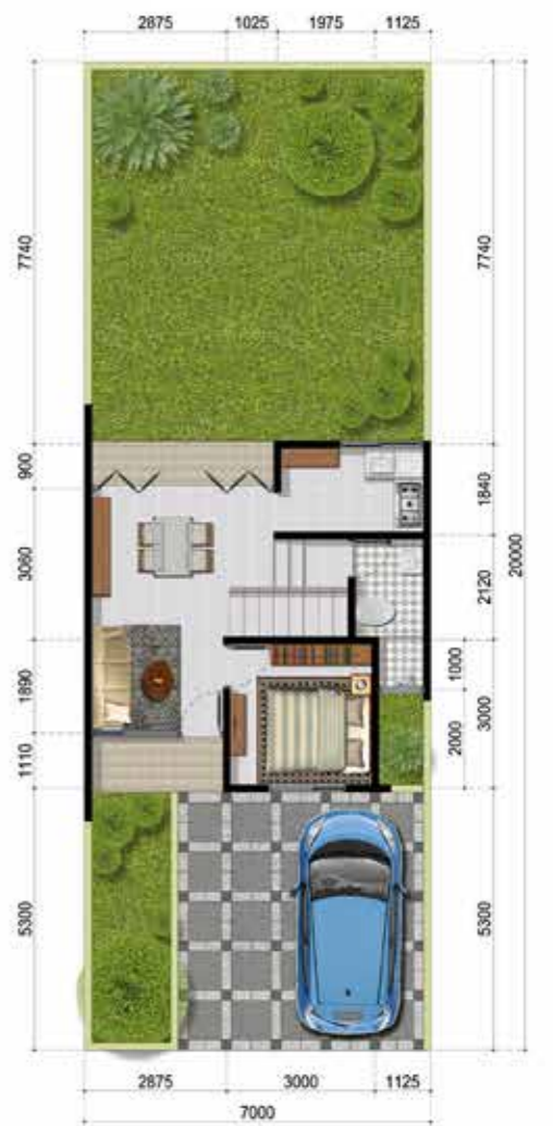
denah LANTAI 1