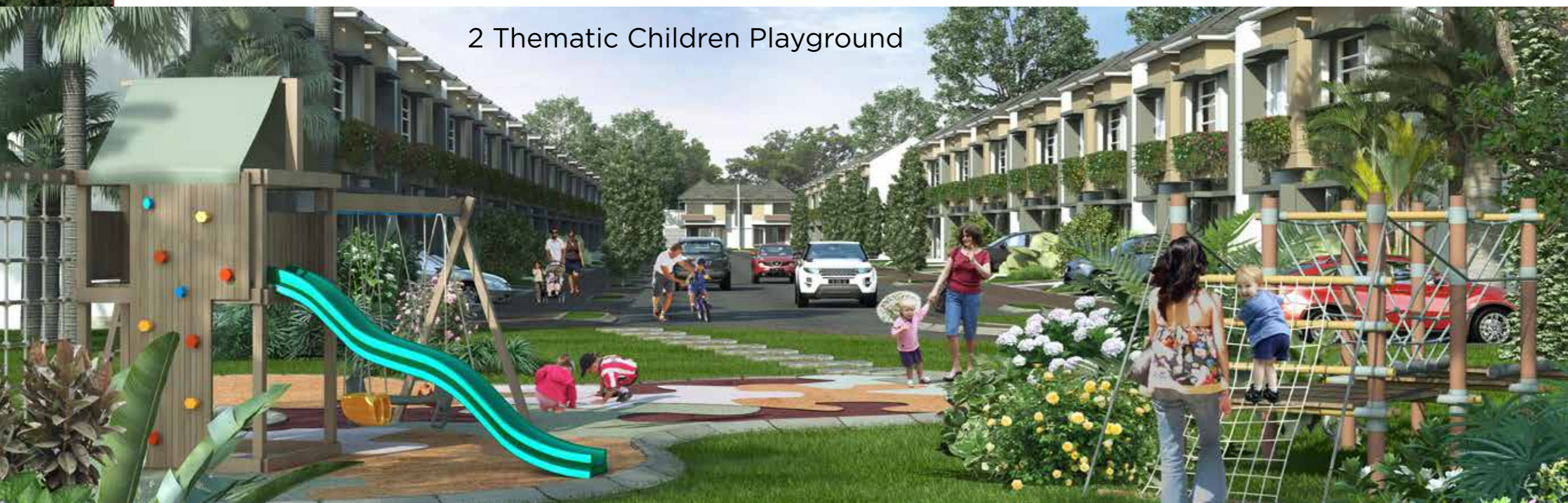
2 Thematic Children Playground