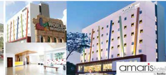
Amaris Hotel & Convention Hall Lokasi di sisi Boulevard Utama, strategis bagi setiap kunjungan dan bisnis anda di barat ibukota.