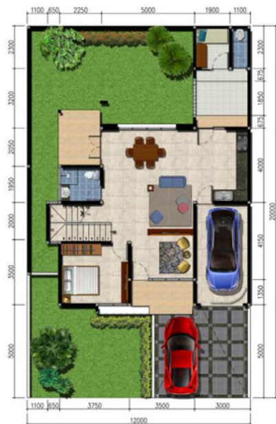
DENAH LB / LT 205 m 2 / 240 m 2