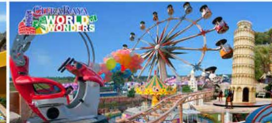
World of Wonders Theme Park sarana rekreasi di CitraRaya. Memiliki berbagai macam fasilitas permainan dan ornamen keajaiban di dunia.