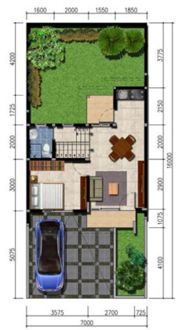
DENAH EXTENSION LB / LT 111 m2 / 112 m2