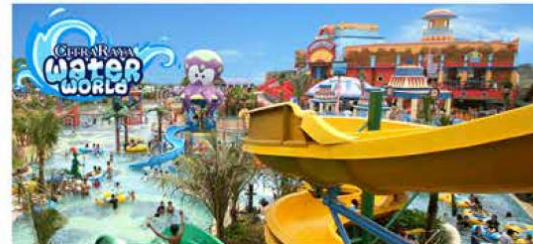
Water World adalah kolam renang rekreasi penuh hiburan bertema bajak laut yang dikunjungi lebih dari 40.000 orang per bulan.