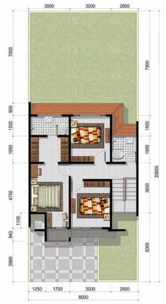
denah LANTAI 2