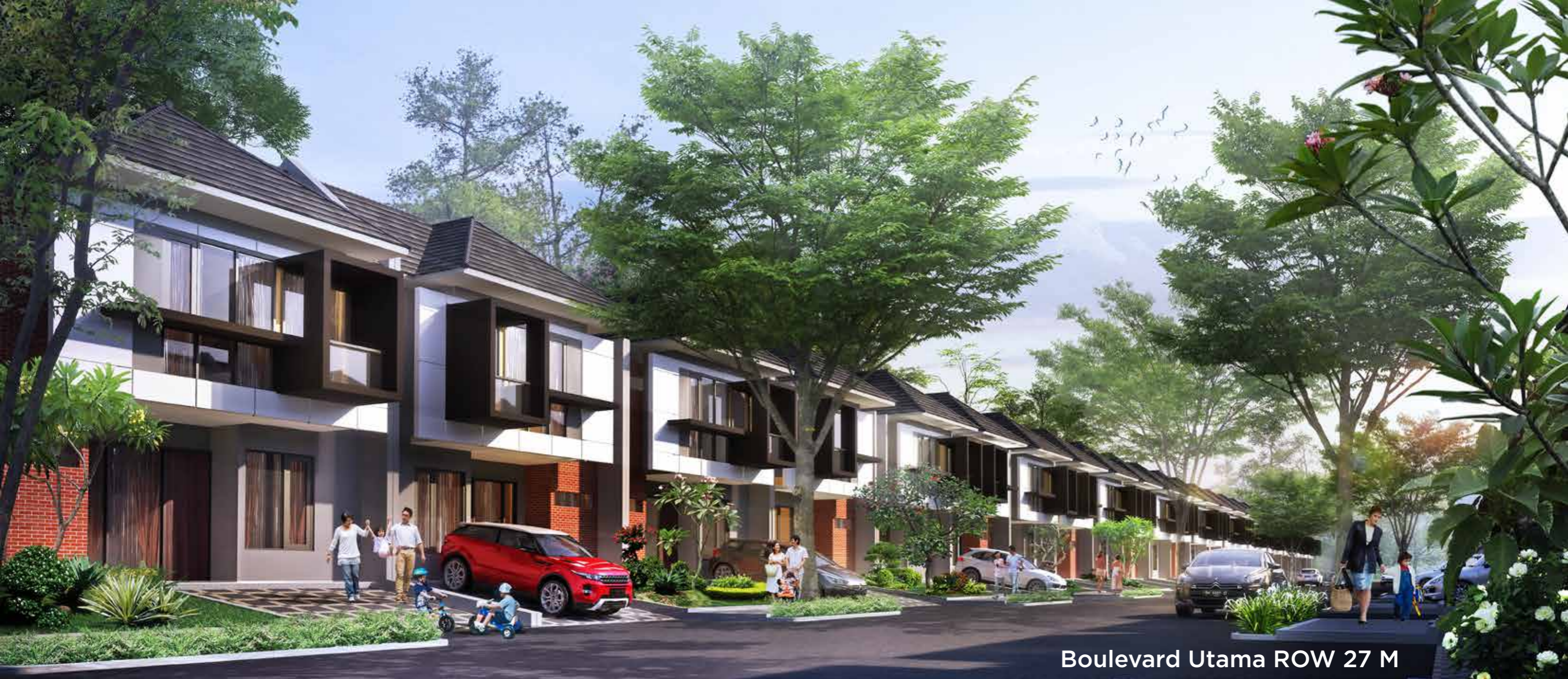
Boulevard Utama ROW 27 M