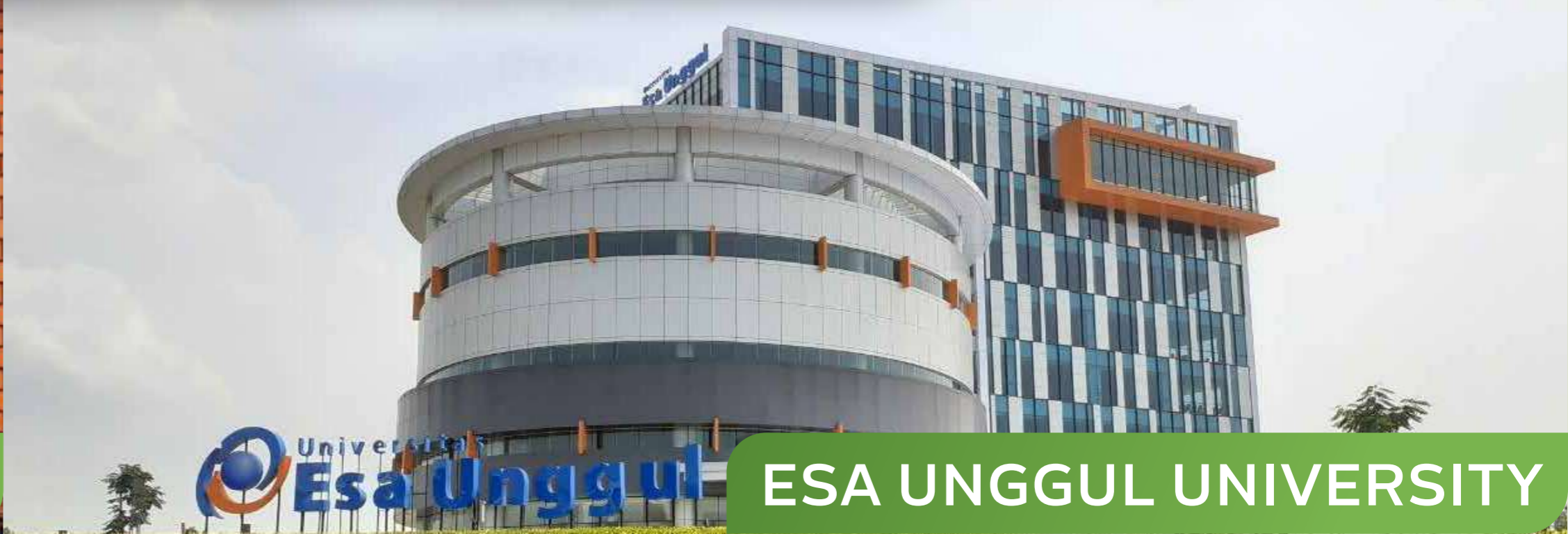
ESA UNGGUL UNIVERSITY