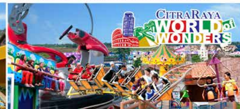
World of Wonders sarana rekreasi terbaru di CitraRaya. Memiliki berbagai macam fasilitas permainan dan ornamen keajaiban di dunia.