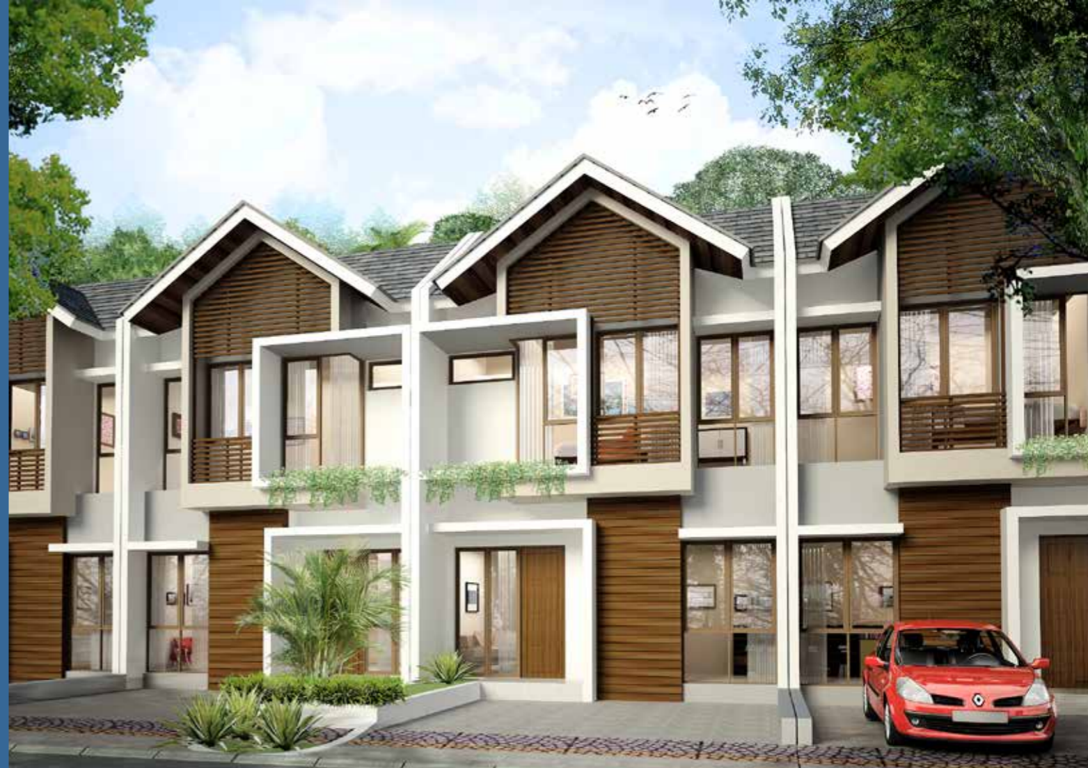
tipe Zeffiro LB : 69 m 2 LT : 96 m 2 ( 2 KT + 1 )