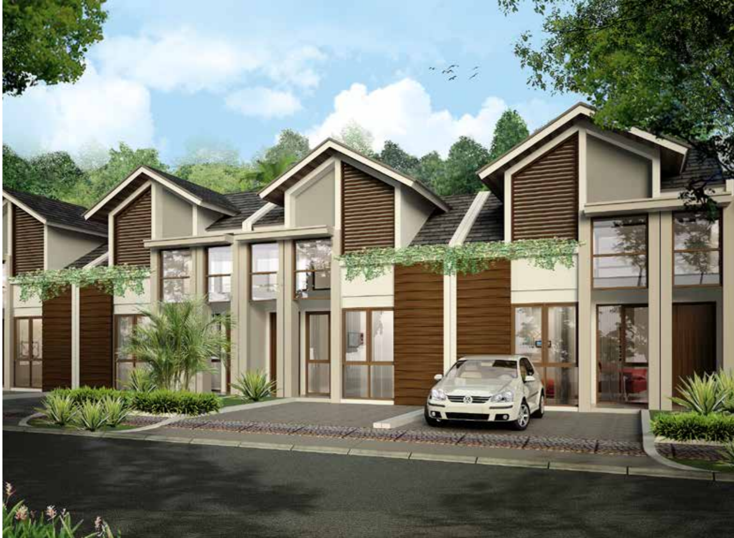
tipe Brezza LB : 50 m 2 LT : 96 m 2 ( 2 KT + 1 )