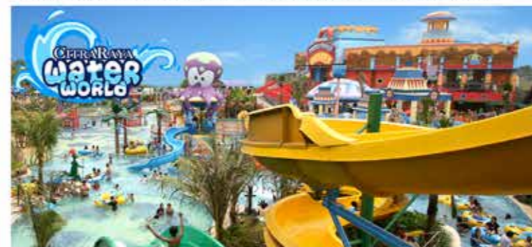
Water World adalah kolam renang rekreasi penuh hiburan bertema bajak laut yang dikunjungi lebih dari 40.000 orang per bulan.