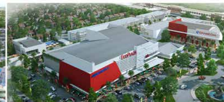
ecoPlaza : Tersedia Food Plaza dan EcoClub ( fitness center, swimming pool, children playground dan jogging track ), berdekatan dengan Gramedia Book Store.