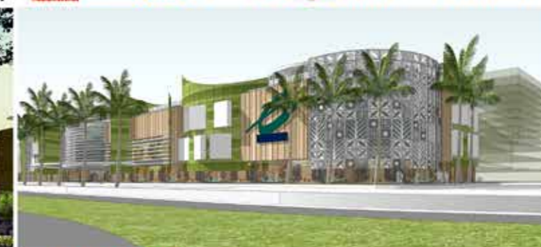
Mall dan Shopping Center untuk memenuhi kebutuhan sehari-hari dan mendukung gaya hidup penghuni. Lokasi strategis dengan ruang terbuka yang luas.