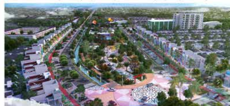
Little Kyoto EcoPark terinspirasi dari suasana resort Kyoto. Terdiri dari taman, retail village dan clubhouse, didesain menggunakan material alami.