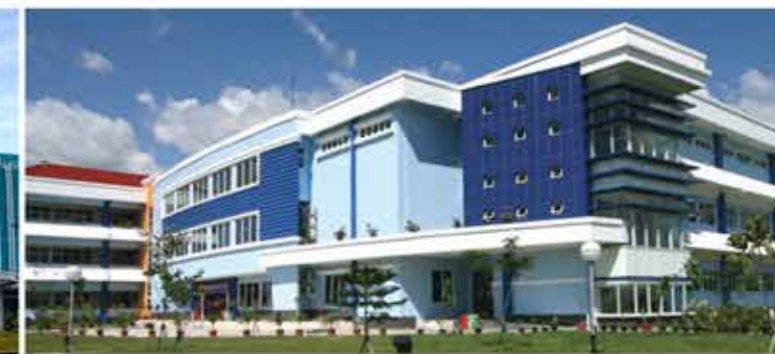
Facilitas pendidikan yang beragam mulai dari Sekolah Citra Berkas, Yayasan Islamic Village, Yayasan Tarakanita dan beberapa sekolah lagi.