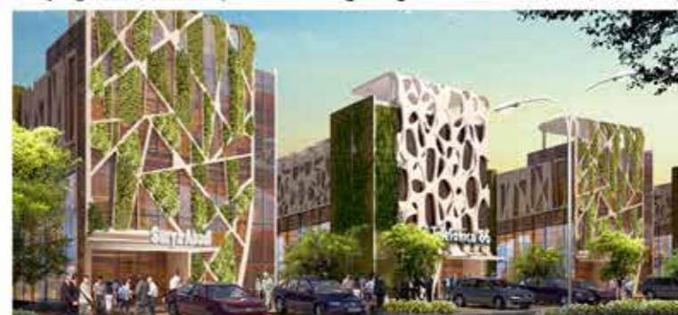
CitraRaya Office Park kawasan bisnis terbaru dan terlengkap untuk memenuhi kebutuhan ruang usaha yang terintegrasi dan letak yang sangat strategis.