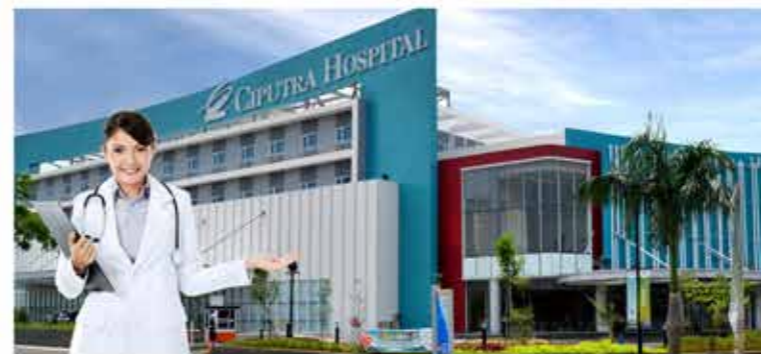
Ciputra Hospital rumah sakit umum swasta pertama dari Grup Ciputra dengan konsep modern, bersih dan hijau ini hadir untuk kebutuhan kesehatan Anda.