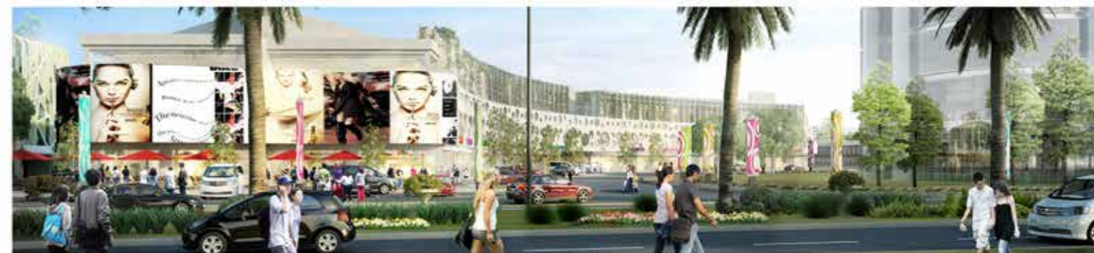
Commercial Center Grand Arcade merupakan tempat belanja, berbisnis dan kuliner yang berlokasi di Ecopolis. Telah bergabung brand-brand ternama di antaranya :