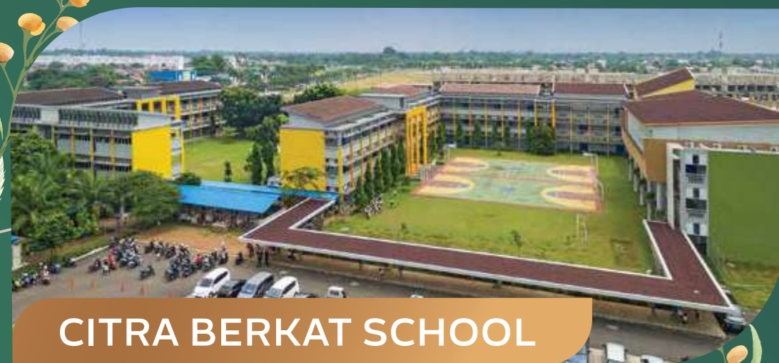
CITRA BERKAT SCHOOL