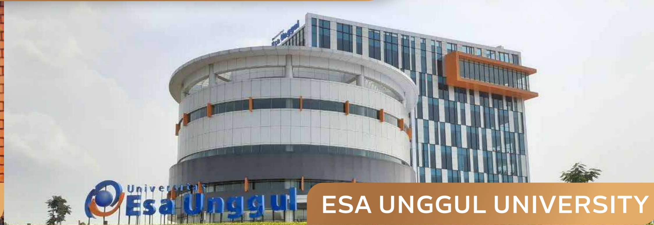
ESA UNGGUL UNIVERSITY