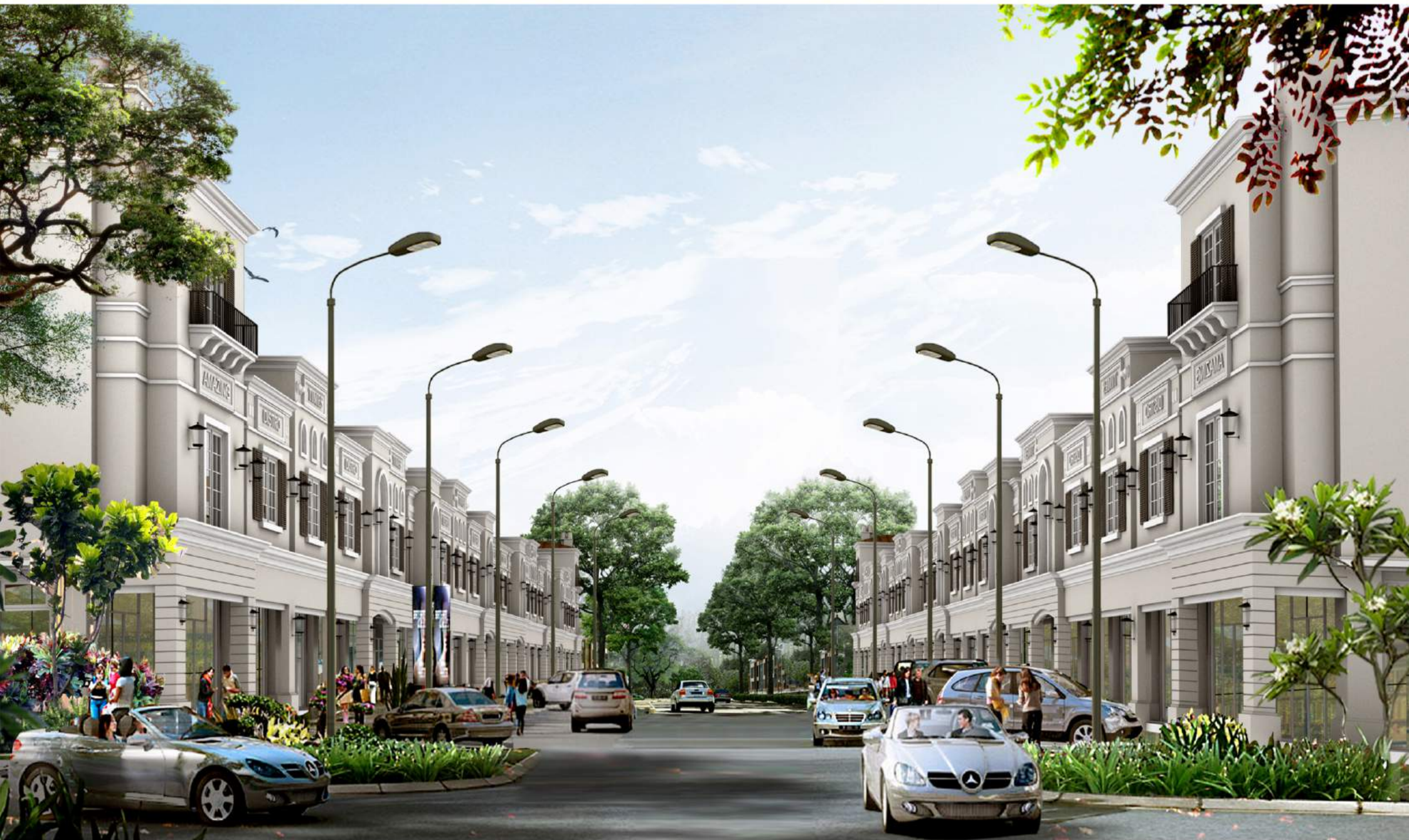
Image yang terdapat pada media ini merupakan ilustrasi seni, developer dapat melakukan perubahan sewaktu-waktu tanpa pemberitahuan terlebih dahulu