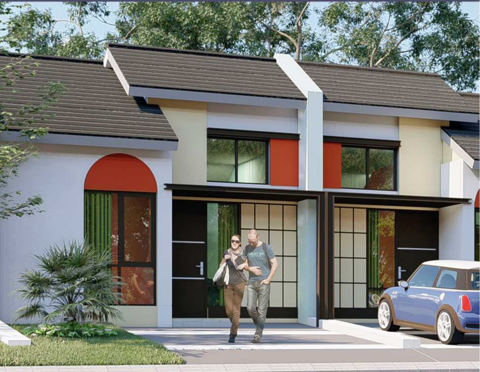
Type 46 6x12