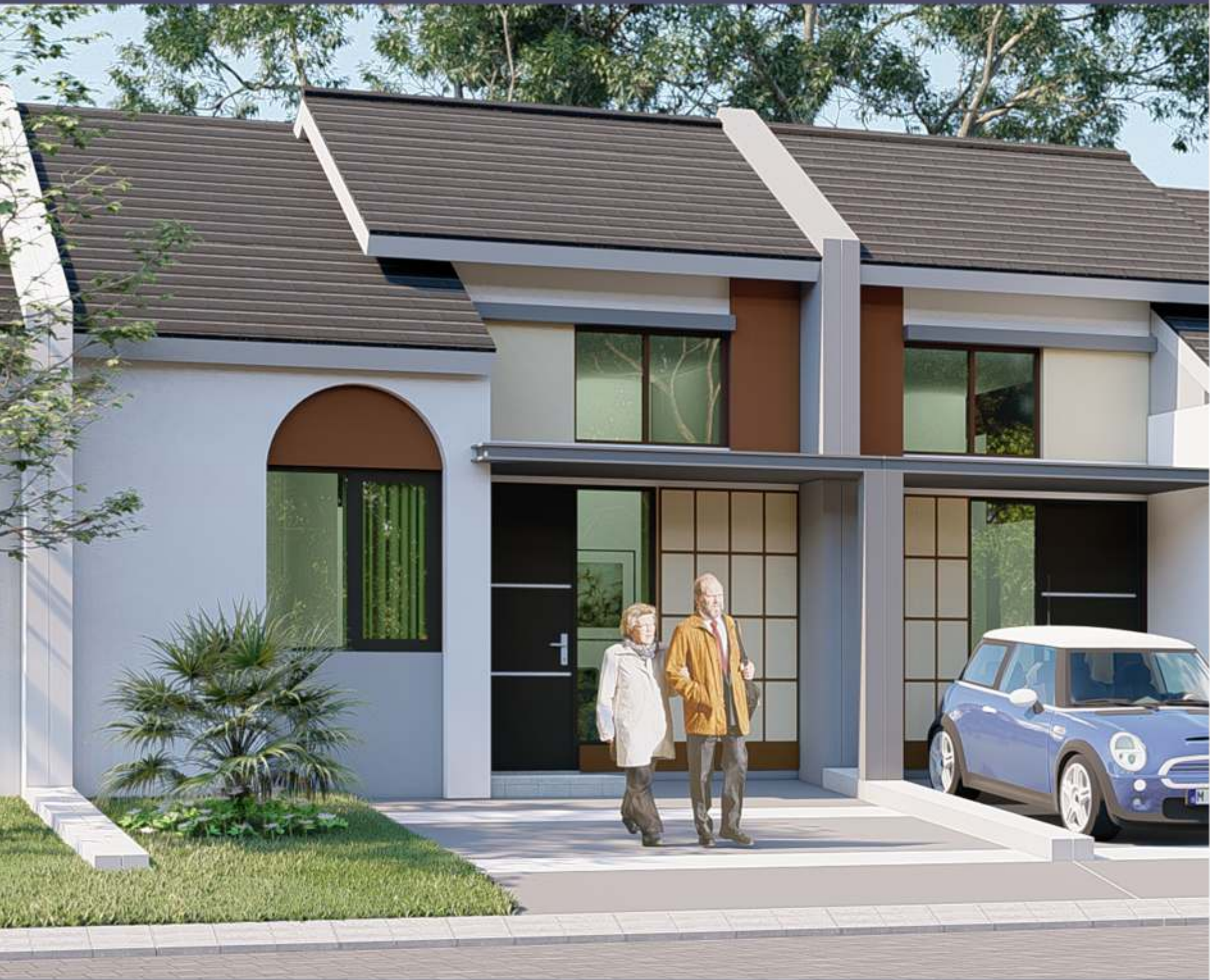
Type 39 6x12