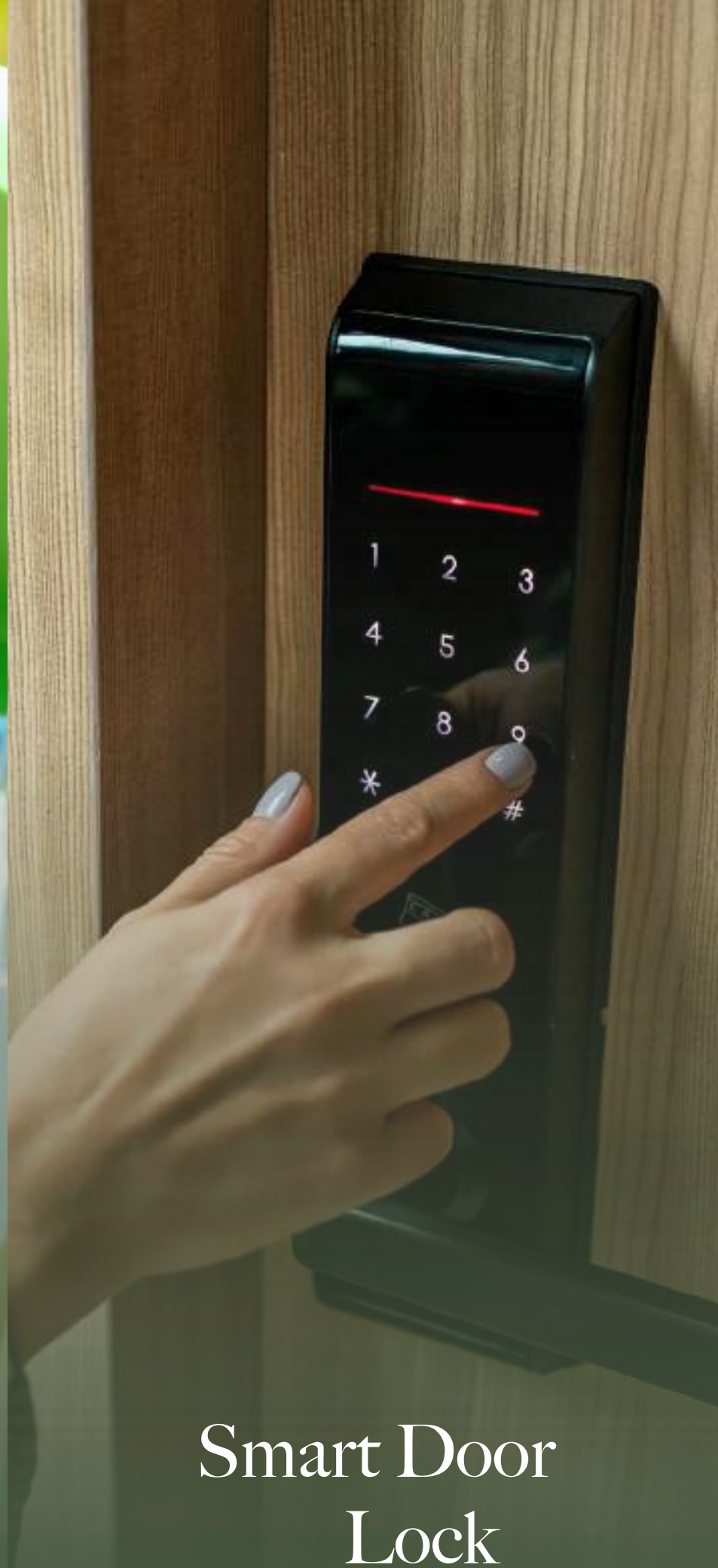
Smart Door Lock