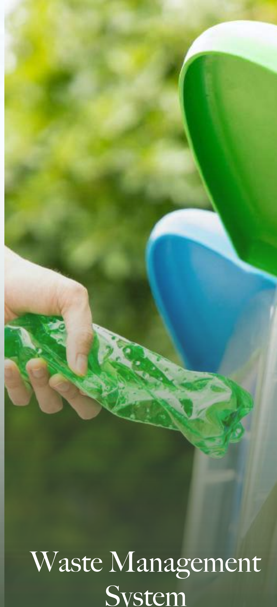
Waste Management System