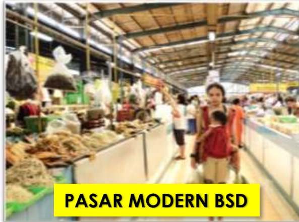
PASAR MODERN BSD