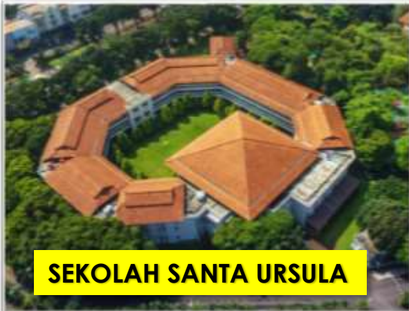
SEKOLAH SANTA URSULA