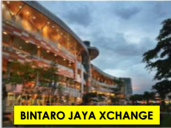
BINTARO JAYA XCHANGE