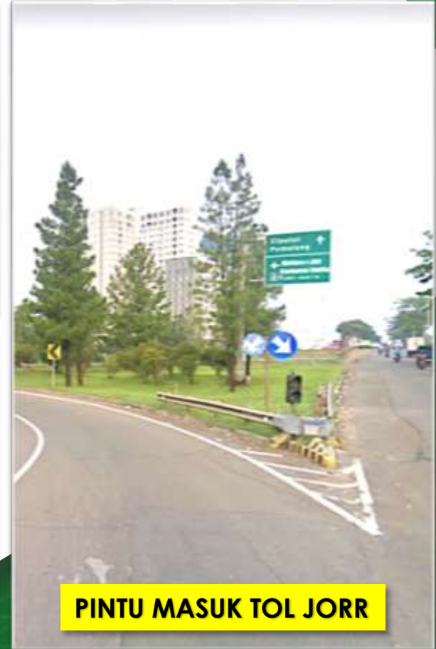
PINTU MASUK TOL JORR