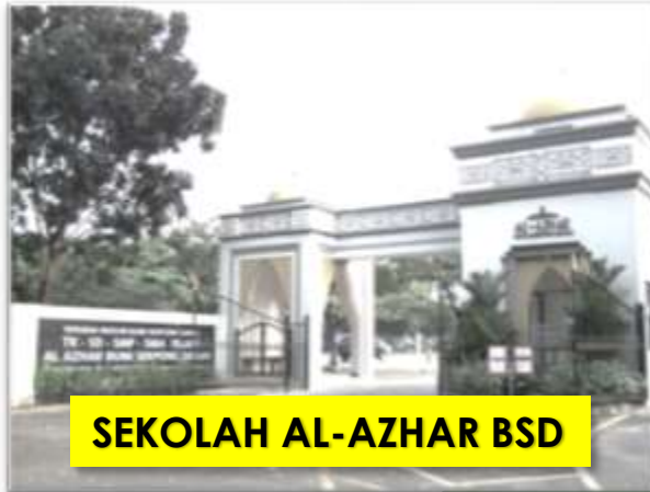
SEKOLAH AL-AZHAR BSD